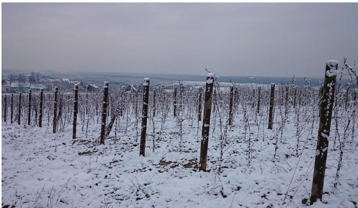
Slika 2. Pokušalište Mandićevac (Mato Drenjančević)