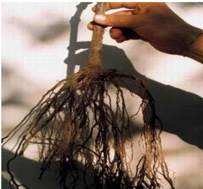
Slika 4. Korijen podloge Kober 5BB

Naši lozni rasadnici u pogledu pravilnog izbora podloga vinove loze, daju najveći udio. Oni naime, već imaju pažljivo odabran sortiment podloga za sve tipove naših vinogradarskih tla i samo na njima proizvode cijepove. Jedna od podloga kod svih najzastupljenija (jer se odlično prilagođuje raznim tipovima tla) je Kober 5BB. S tom podlogom zasađene su u sjevernim i južnim područjima hrvatske najveće površine naših vinograda. Raširena je u svim vinogorjima, jer dobro podnosi sve tipove tla, osim vlažnih i izrazito suhih. Jednako dobro uspijeva na tlima bez vapna, kao i na onima koji ga sadrže 30-40 posto ukupnog i do 20 posto aktivnog. Ta se podloga vrlo dobro ukorijenjava, ima dobar afinitet (sraštavanje) sa svim našim sortama i povoljno utječe na bujnost i rodnost svih sorata vinove loze (Mirošević i sur., 2009 .).