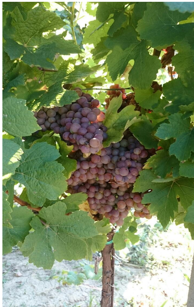
Slika 5. Traminac mirisavi (Mato Drenjančević)

Dozrijevanje je ranije ili u srednje doba. Mehanizirana berba otežana je zbog zgusnute nepravilne vegetacije, smještaja grozdova i težeg odvajanja bobica od peteljčice. Umjerene je otpornosti na gljivične bolesti, a manje je otporna protiv nekih štetnika. Dobro podnosi niske zimske temperature. Vino je slavnato žute boje s većim sadržajem alkohola, specifične arome, harmonično, mekano, vrlo fino.