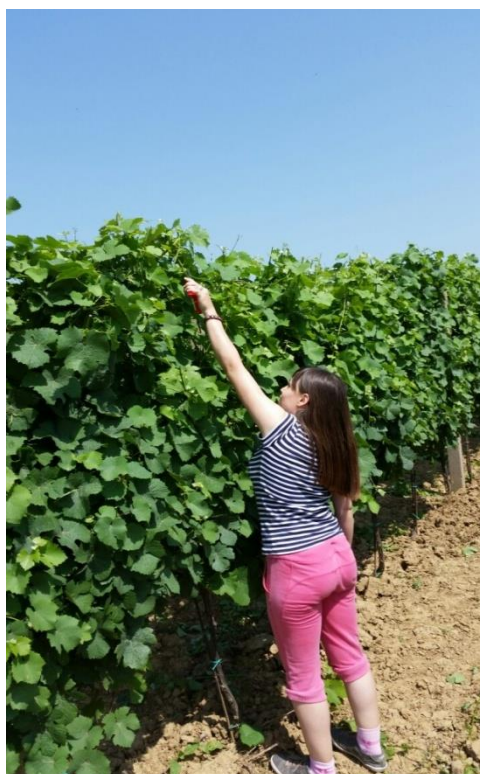
Slika 6. Vršikanje ( Autor )