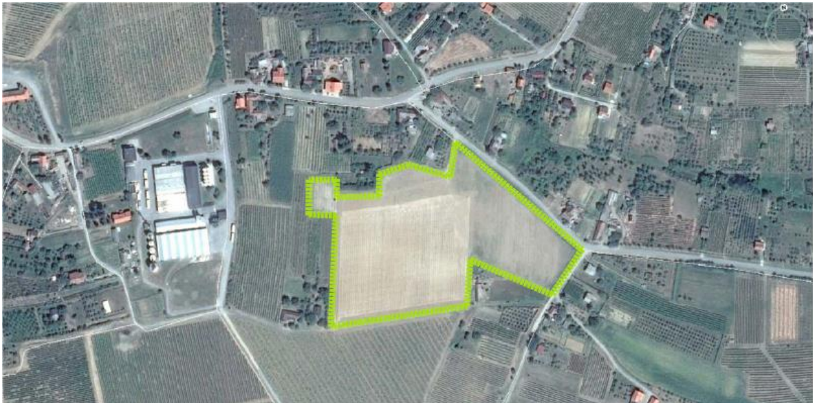
Slika 3. PokušališteMandićevac – snimka iz zraka

Vinograd na kojemu je postavljen pokus smješten je na lokaciji Mandićevac koja se nalazi u blizini vinarije Đakovačka vina d.d. s istočne strane; površine 3,3570 ha, nepravilnog poligonalnog oblika, južne ekspozicije s generalnim padom W→ E od 9,8 %. Ukupna pokusna površina je 14534 m 2 . Međuredni razmak je 2,2 m, a unutar reda 0,8 m.