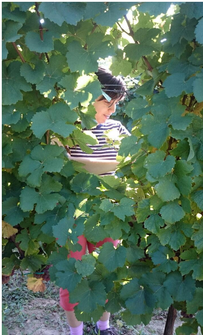
Slika 7. Uzimanje uzoraka za analizu

Nakon što je obavljeno vršikanje uslijedila je berba 2. rujna 2016. godine. Na pokusu smo uzeli 10 uzoraka iz redova koji su vršikani i 10 uzoraka iz redova koji nisu vršikani. Nakon toga smo izmjerili šećere, ukupnu kiselost i pH svih 20 uzoraka.