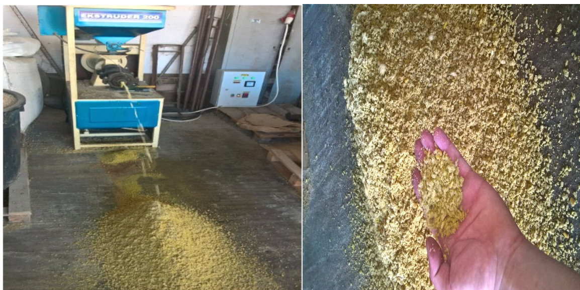
Slika 13: Ekstruder u radu (Foto: M. Lučić),

Ako se uradi kvalitetna termička obrada (tostiranje, ekstrudiranje) soja će imati 33-44 % proteina, 15-22 % masti i čak 60 % by-pass proteina/belančevina.