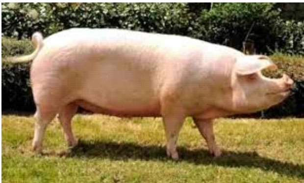
Slika 2: Krmača landras

Landrasi su zapravo skupina pasmina koja je nastala križanjem domaćih svinja u pojedinim zemljama Europe s velikim jorkširo i još ponekom pasminom. Najčešće razlikujemo dva tipa unutar ove skupine, a to su skandinavski tip landrasa koji se uzgaja u Švedskoj,