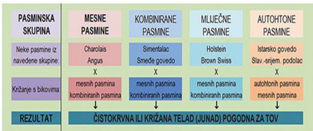
Slika 2. Različite pasmine u tovu junadi

Svakako kada govorimo o tovu junadi i proizvodnji mesa moramo spomenuti i kombinirane pasmine ( Simentalska pasmina , Smeđe govedo , Sivo govedo ) koje su selekcionirane na proizvodnju i mlijeka i mesa (Jakopović, 2007.; Ferizbegović i sur., 2009.; Senčić i sur., 2010.; Kralik i sur., 2011.). Kombinirane pasmine, premda nemaju najbolje toвне predispozicije, mogu dati izvrsne priraste i kvalitetu mesa. Na tovilištima se često mogu zateći križanci, uglavnom mesnih pasmina goveda, koji postižu dobru dinamiku rasta i povoljnu kvalitetu mesa (Slika 2.).