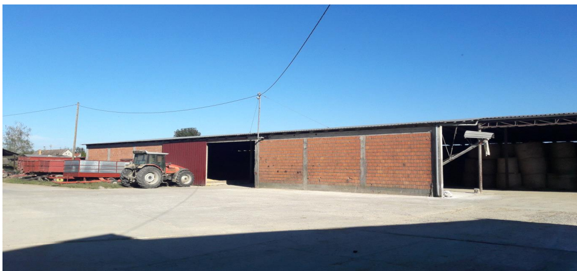
Slika 11. Podno skladište

Skladišni kapacitet za žitarice i krmiva je podno skladište u kojem se nalaze suhe komponente, tritikal (pšenoraž), soja, vitaminski premiksi. Podno skladište se prostire na oko 800 m 2 i visine je 4 m. U njemu se skladišti pšenoraž koju sijemo na vlastitim površinama, a jako je dobra komponenta u hranidbi tovnih kategorija. Soja, odnosno njena sačma je izvrsno bjelančevinasto krmivo koje je također skladišteno u hangaru. U hangaru se nalazi i mlin koji suhe komponente melje, i miješa s vitaminskim komponentama u miješaoni koja je u sklopu mlina. Time se postiže pozitivan omjer svake komponente u obroku te naravno njihova dobra homogenost u obroku.