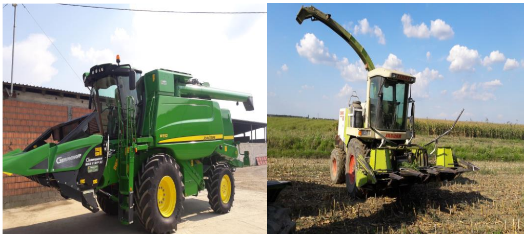
Slika 21. Žitni i silažni kombajn

Također posjedujemo dva kombajna od kojih je jedan silažni, a jedan takozvani žitni, pomoću kojih skidamo usjeve u vrijeme njihove zriobe.