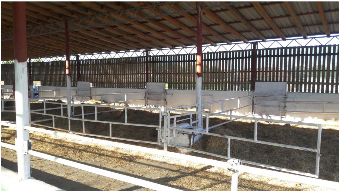
Slika 9. Objekat za tov 4. – unutrašnjost