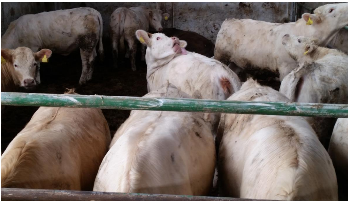
Slika 16. Junice charolais pasmine