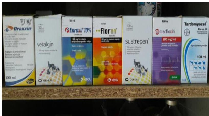
Slika 23. Lijekovi za junad