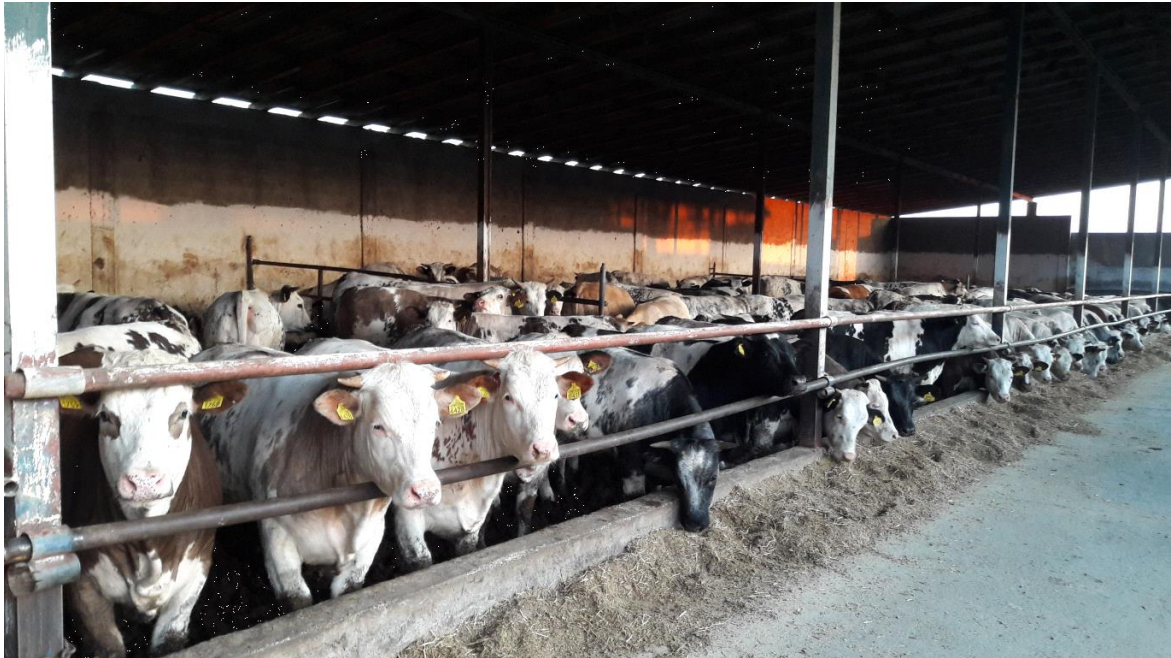
Slika 7. Objekat za tov 3.