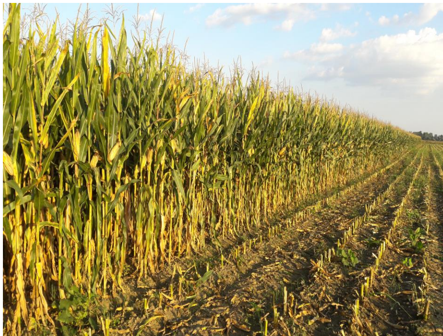
Slika 17. Silažni kukuruz

kukuruzom nam je nešto veća od raspoložive, te vršimo otkup još nekolicine kukuruza, ovisno o prinosu i godini.