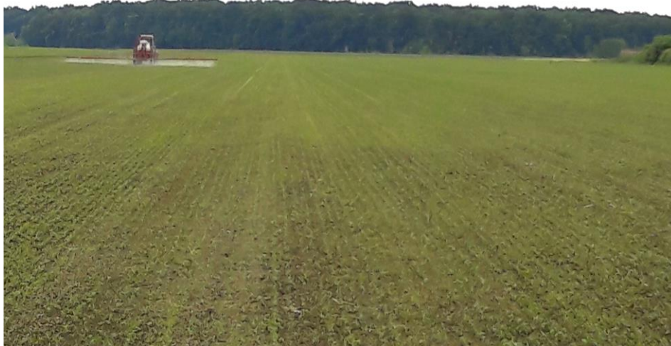
Slika 18. Soja