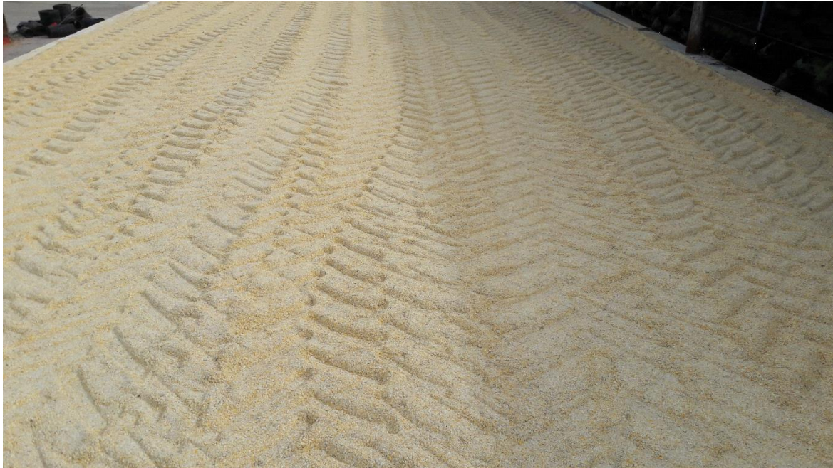
Slika 13. Visoko vlažni kukuruz