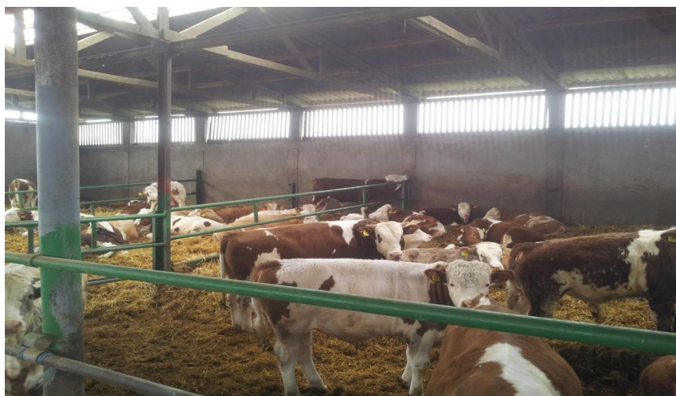
Slika 15. Grla simentalke pasmine

Simentalac i Charolais se na obiteljskom poljoprivrednom gospodarstvu nalaze u nešto manjem broju, ali ih ipak imamo zbog neke određene ponude i potražnje prema kupcima. Grla imaju velik dnevni prirast, dobar randman, te zadovoljavajuću prodajnu cijenu na tržištu.