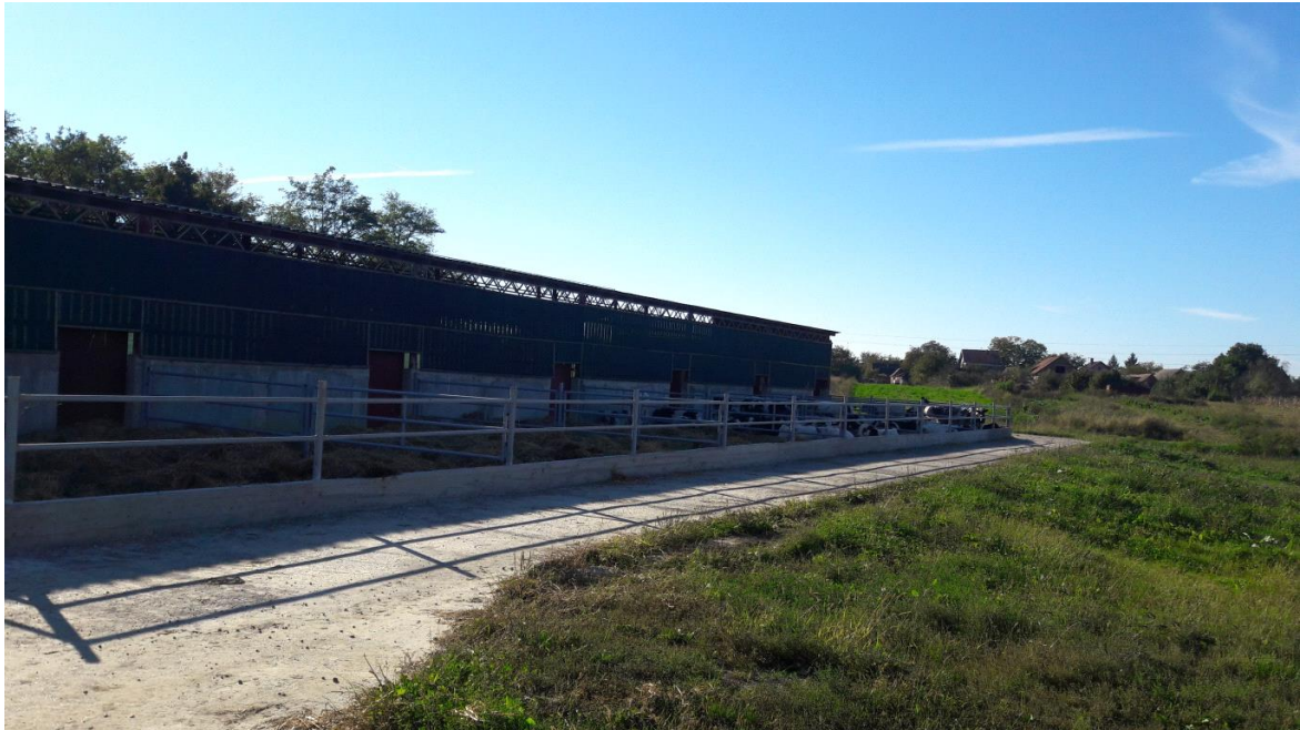
Slika 8. Objekat za tov 4. – vanjski boksovi