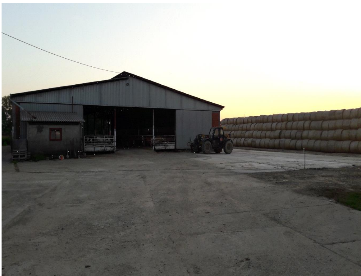
Slika 5. Objekat za tov 2. – vanjski izgled

Drugi objekat za tov je više suvremenije izvedbe odnosno praktičniji za tov junadi za razliku od prethodno spomenutog objekta na našem gospodarstvu. Građen je 2006. godine vlastitim sredstvima. Objekat je dug 38 metara i širine je 24 metra. Sa svake strane se nalazi pet boksova za junad. Objekt se iznojava na principu kose ploče, odnosno kosog ležišta za goveda koja su smještena u njemu te koja svojim kretanjem guraju stajnjak niz kosinu u blatni hodnik. Stajnjak iz blatnog hodnika se strojno iznosi van objekta. Slamljenje se vrši tri puta tjedno, također uz pomoć mehanizacije – strojno. S oba čela objekta se nalaze klizna vrata cijelom površinom, te se otvaraju i zatvaraju, ovisno o vanjskim uvjetima. Grla se napajaju iz termo pojilica, koje sprječavaju njihovo smrzavanje zimi. Kapacitet objekta je od 160 – 180 grla u jednom turnusu.