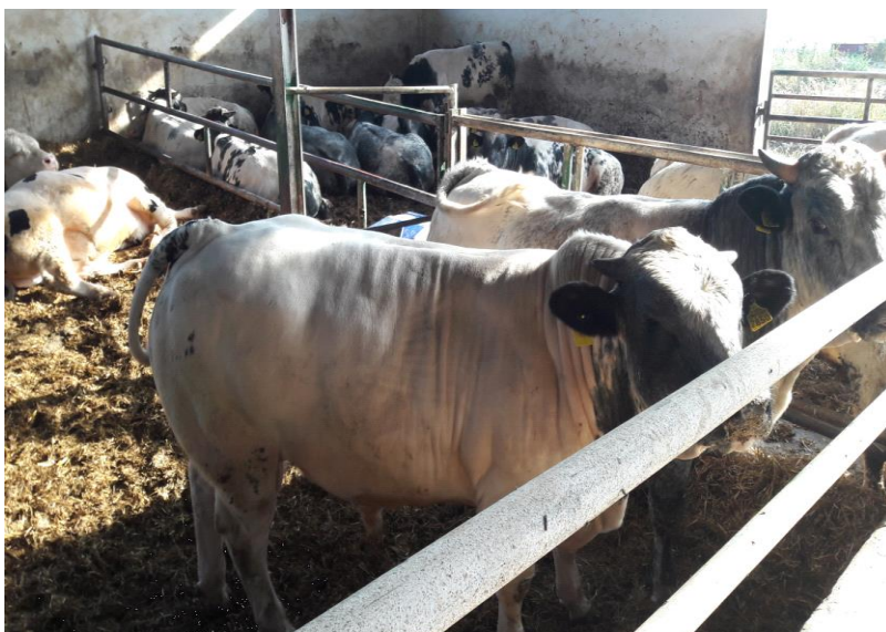
Slika 14. Grla belgijsko – plave pasmine