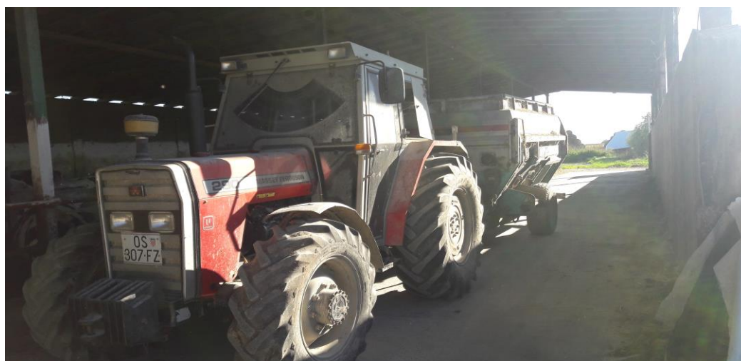
Slika 19. Mikserica (mikser prikolica) i traktor

proizvođača, zapremine 8 m 3 . Mikser prikolica ima vodoravne puževe koji su se pokazali boljima u slučaju kada nam je zaista potrebno kvalitetno izmješavanje hrane, bez velike potrebe za usitnjavanjem bala u njoj. Mikser prikolicu pogoni kardansko vratilo traktora. Na prikolici je Masey Ferguson snage 63,38 kW, koji preko kardana vrti pužnice u mikser prikolici i tako miješa obrok za junad.