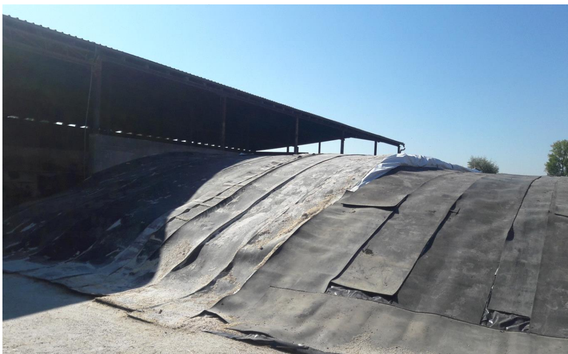
Slika 12. Visoko vlažni kukuruz u trenč silosima

Trenč silosi za vlažnu i voluminoznu komponentu su betonski zidovi, koje spaja betonska ploča na podu. Sva krmiva se istresaju u trenč silos te se gaze teškim strojevima. Tim postupkom se istiskuje zrak, te se sprječavaju aerobni uvijeti, kako ne bi došlo do kvarenja. Gore se prekriva folijom koja sprječava prokišnjavanje, dolazak zraka i sl. Dobro uskladištena krma u trenč silosu može dugo trajati, bez ikakvih znakova kvarenja.