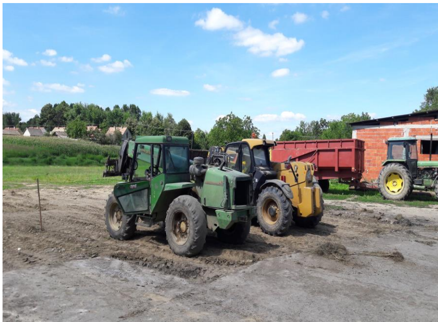
Slika 20. Telehenderi na farmi