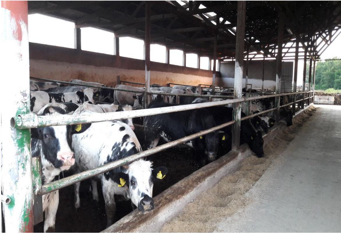
Slika 6. Objekat za tov 2. – unutrašnjost