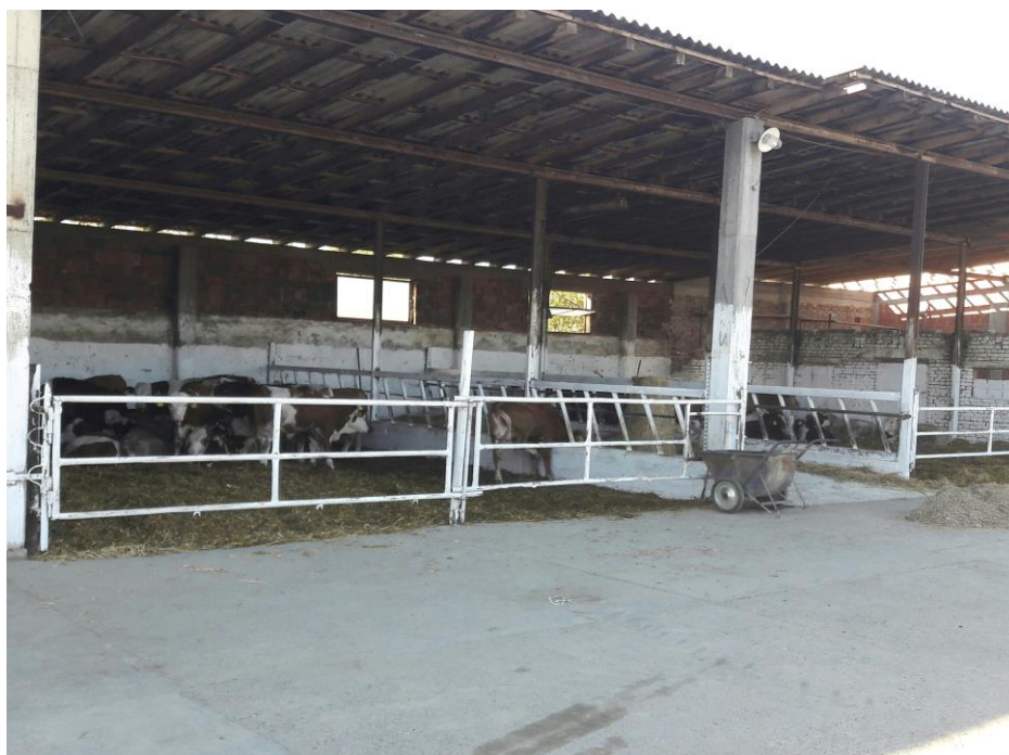
Slika 4. Objekat za tov 1.

Najstariji objekat za tov na farmi je s tzv. krovom na jednu vodu. S tri strane je zatvoren zidovima, a s jedne je otvoren. Grla se kreću slobodno, a sam prostor je jako prozračan, tako da je povoljan za telad. Kapacitet objekta je 60 – tak životinja, s tim da su sve životinje podijeljene u dva boksa, a dijeli ih hranidbeni hodnik.