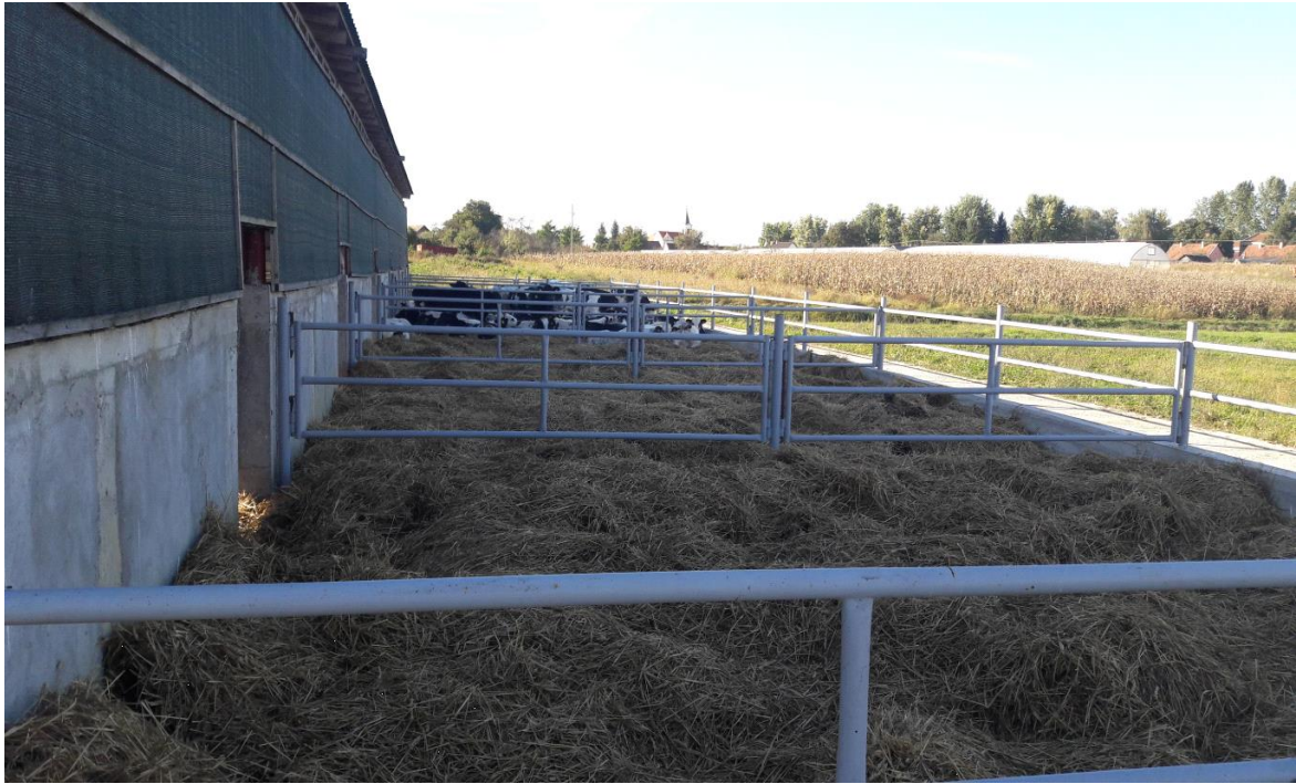
Slika 10. Ispusti za pripremu teladi