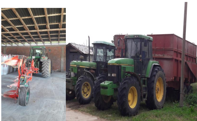
Slika 22. Traktori