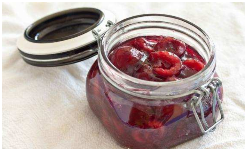
Slika 3. Kompot od trešnje

https://www.google.hr/search?q=kompot+tre%C5%A1nja&source=lnms&tbn=isch&sa=X&ved=0ahUKEwjPgISI3YzQAhUnL8AKHT2eAhwQ_AUICCGB&biw=1600&bih=794#imgrc=P6KkdrndZA9HBM%3A