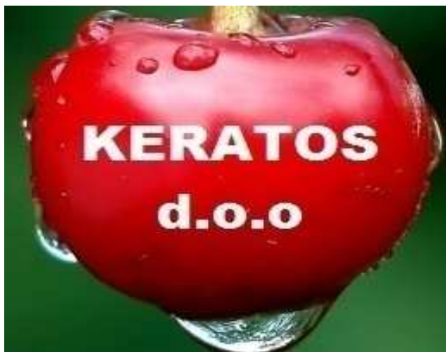
Slika 2. Figurativni žig

Obrazac Ž-1 za zaštitu figurativnog žiga na teritoriju Republike Hrvatske nalazi se u prilogu