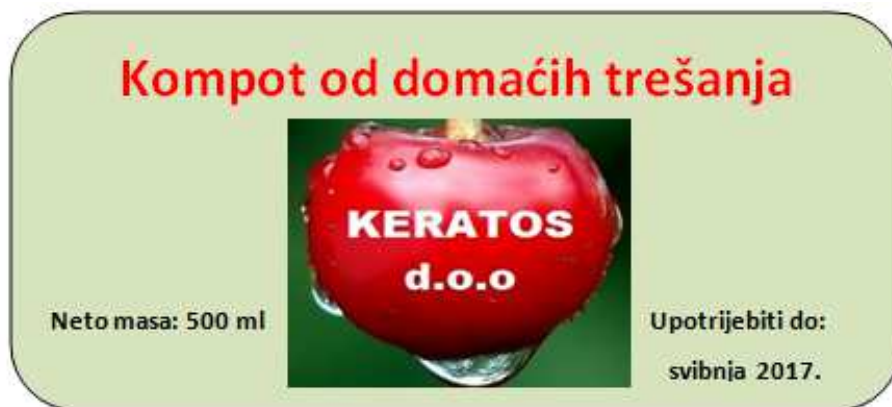
Slika 6. Etiketa proizvoda

https://www.google.hr/search?q=cherry+juice&source=lnms&tbm=isch&sa=X&ved=0ahUK Ewib_O3NiqHQAhXnJMAKHTp0AMkQ_AUICCgB&biw=1600&bih=794#tbm=isch&q=trešnja+sok&imgsrc=Lw7CPD8Z35YMvM%3A