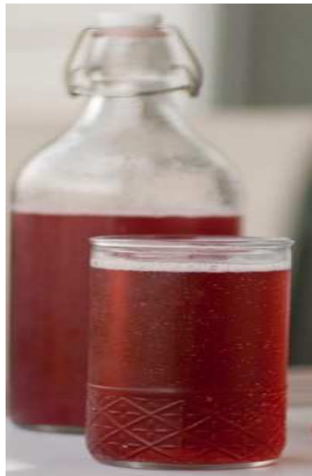
Slika 4. Sirup od trešnje