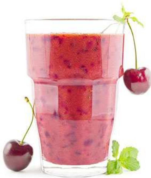
Slika 5. Sok od trešnje

https://www.google.hr/search?q=cherry+juice&source=lnms&tbm=isch&sa=X&ved=0ahUK Ewib_O3NiqHQAhXnJMAKHTp0AMkQ_AUICCgB&biw=1600&bih=794#tbm=isch&q=trešnja+sok&imgsrc=Lw7CPD8Z35YMvM%3A