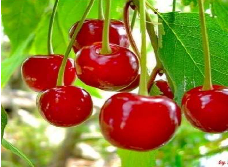
Slika 1. Plod trešnje Van

mehanizam djelovanja nije još jasan, znanstvenici smatraju da trešnje djeluju poput uobičajenih lijekova koje sportaši uzimaju kako bi olakšali upalno stanje poslije tjelesne aktivnosti. Peteljka trešnje obiluje taninima, organskim kiselinama, flavonoidima, šećerima i mineralima. Zahvaljujući svome sastavu, peteljke su se u narodnoj medicini koristile za čajeve koji potiču izlučivanje mokraćne i izbacivanje kamenaca iz bubrega i mokraćnog mjehura.