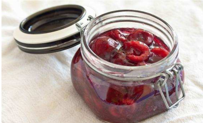
Slika 3. Kompot od trešnje

https://www.google.hr/search?q=kompot+tre%C5%A1nja&source=lnms&tbn=isch&sa=X&ved=0ahUKEwjPgISI3YzQAhUnL8AKHT2eAhwQ_AUICCGB&biw=1600&bih=794#imgrc=P6KkdrndZA9HBM%3A