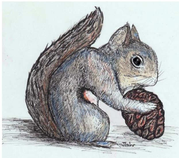
Slika 4: Daglas vjeverica otvara češer

Sequoiadendron giganteum Lindl. se na mnogo načina prilagodio na šumske požare. To je jedan od razloga zašto je dugovječan. Kora je pirootporna a češer se cijeli rastvori uslijed temperature. Sequoiadendron giganteum Lindl. imaju jako velikih problema kod razmnožavanja u prirodnom arealu, a posebice gdje su kultivirano uzgojene, jer sjemenke rastu uspješno samo na mineralno bogatim tlima i na punoj insolaciji. Sjeme također uništi humidnost češera u proljeće, uslijed velike vlage zraka i oborina. Iako čudno zvuči, šumski je požar poželjan u prirodnim arealima Sequoiadendron giganteum Lindl., jer očisti stanište od šikara i drugih manjih, agresivnijih biljnih vrsta, a pošto je golemi mamutovac daleko otporniji od požara od ostalih vrsta u takvim uvjetima može slobodno rasti bez „konkurencije“. Vatra im je također korisna jer ubija populacije „šećernih mrava“ (lat. Camponotus spp, eng. Carpenterants). Osim vatre, neke vrste kukaca su također korisne za otvaranje češera. Ležu jaja u češere i ličinke buše rupe u češeru kroz koje sjeme slobodno ispada. Daglas vjeverica isto pomaže u otvaranju češera. Ona pojede većinu češera i tako sjemenke mogu slobodno ispasti iz njega (sl.4).