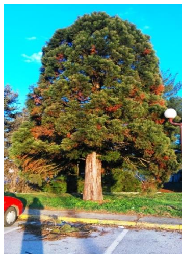
Sl. 6 - napad potkornjaka - lokacija Pevec Osijek

Štete koje uzrokuje ovaj štetnik su velike i mogu dovesti do potpunog sušenja biljke. Pojava napada potkornjaka vidljiva je radi sušenja vršnih izbojaka i iglica (Sl. 6).