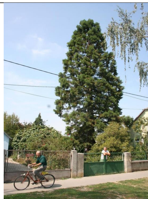
Sl. 8 Privatna Sequoiadendron giganteum Lindl.