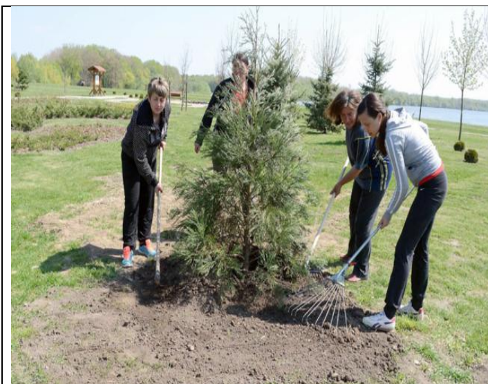
Sl. 7 Sadjnja Sequoiadendron giganteum Lindl.

U Hrvatskoj se ova egzota sadi i danas i može se naći na javnim površinama (sl.8), Ali i u privatnim vrtovima (10).