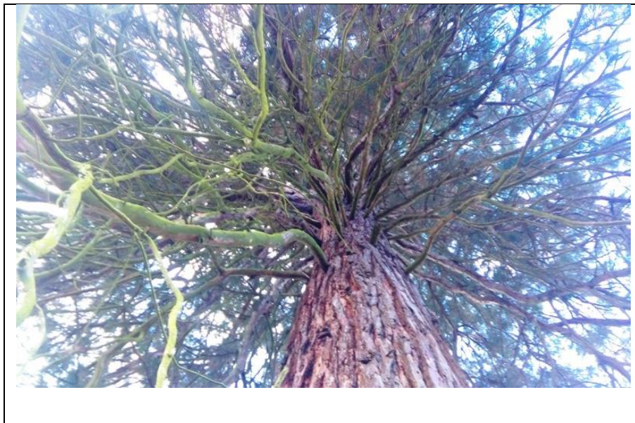
Slika 2: osušene grane Slatinske sekvoje, Izvor: Ivan Nekić, 2016

Donje grane sekvoje često odumiru od zasjenjivanja što je normalna pojava. Posebno je izražena kod sekvoja starijih od 100 godina (Sl. 2)