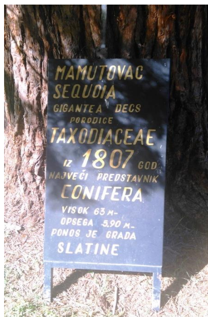
Sl.9. Ploča sa natpisom godine sadnje stabla, koja je pogrešna, Izvor: Ivan Nekić, 2016.

Priča oko Sequoiadendron giganteum Lindl. u Slatini počinje pogledom na veliku ploču koja je istaknuta ispred stabla u Slatini i na kojoj piše da je ovo stablo posađeno 1807. godine (Sl. 8). Stablo je zaštićeno kao spomenik parkovne arhitekture pri Ministarstvu zaštite prirode. Proučavajući vrijeme introdukcije pojedine biljne vrste u hrvatsku, gotovo je nemoguće da je ona posađena već 1807. godine, jer te godine nije bili niti otkrivena a niti determinirana kao nova biljna vrsta koja je tek kasnije dobila svoje ime. Zaista čudi da se ista godina navodi i na stranicama Javne ustanove Županije, što govori o nedovoljno istraženoj povijesnoj genezi i nebrizi djelatnika koji u njoj rade. Objašnjenje koje pričaju unutar Zavičajnog muzeja grada Slatine da je ovo stablo zasađeno u vrijeme Schaumburg Lippe-a, te da su ga posadili njegovi podređeni službenici, imitirajući ga, vremenski odgovara istinitosti o starosti ovog stabla.