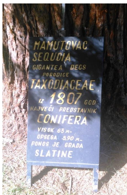
Sl.9. Ploča sa natpisom godine sadnje stabla, koja je pogrešna, Izvor: Ivan Nekić, 2016.

Priča oko Sequoiadendron giganteum Lindl. u Slatini počinje pogledom na veliku ploču koja je istaknuta ispred stabla u Slatini i na kojoj piše da je ovo stablo posađeno 1807. godine (Sl. 8). Stablo je zaštićeno kao spomenik parkovne arhitekture pri Ministarstvu zaštite prirode. Proučavajući vrijeme introdukcije pojedine biljne vrste u hrvatsku, gotovo je nemoguće da je ona posađena već 1807. godine, jer te godine nije bili niti otkrivena a niti determinirana kao nova biljna vrsta koja je tek kasnije dobila svoje ime. Zaista čudi da se ista godina navodi i na stranicama Javne ustanove Županije, što govori o nedovoljno istraženoj povijesnoj genezi i nebrizi djelatnika koji u njoj rade. Objašnjenje koje pričaju unutar Zavičajnog muzeja grada Slatine da je ovo stablo zasađeno u vrijeme Schaumburg Lippe-a, te da su ga posadili njegovi podređeni službenici, imitirajući ga, vremenski odgovara istinitosti o starosti ovog stabla.