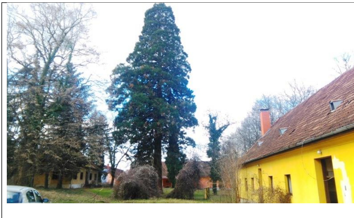
Slika 1: Sequoiadendron giganteum Lindl. u Slatini, Izvor: Ivan Nekić, 2015

U ovom radu biti će opisane sve karakteristike roda i vrste, primjena i učestalost pojavnosti vrste u Hrvatskoj s posebnim osvrtom na Sequoiadendron giganteum Lindl. u Slatini.