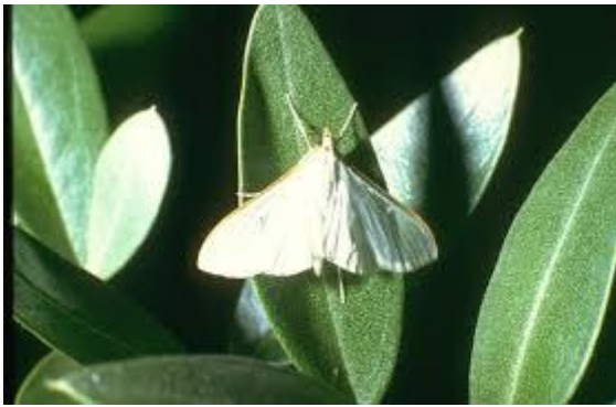
Slika 3. Leptir jasminovog moljca

Za kemijsko suzbijanje u Republici Hrvatskoj za ovu godinu dopušteno je sredstvo Cythrin max.