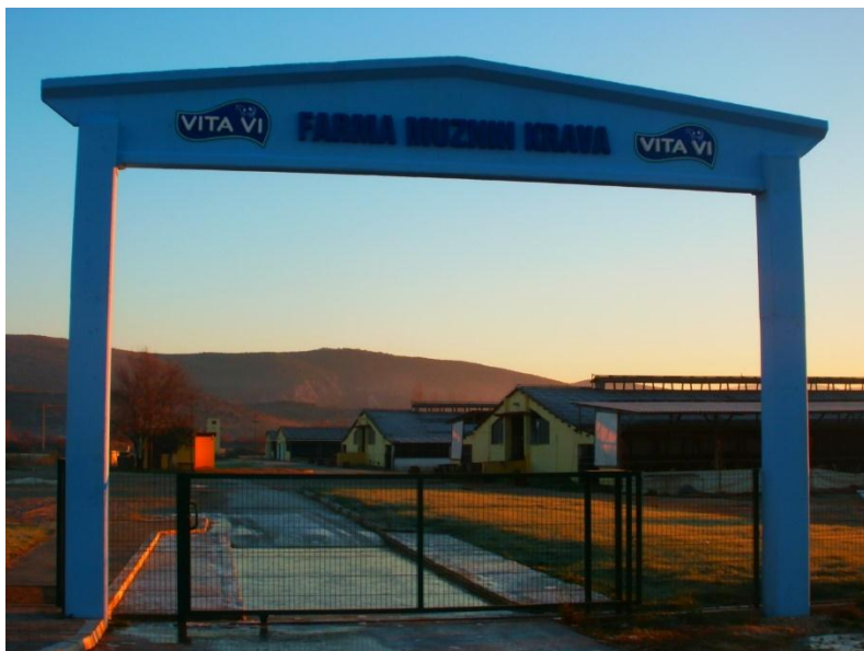
Slika 1. Farma Vita Vi

Farma Vita Vi d.o.o. osnovana je 1997. godine. Nalazi se u KO Višići, općina Čapljina. Sa zapadne strane je omeđena Parkom prirode „Hutovo blato“, sa južne strane sa „Agroherc d.o.o.“, sa zapadne strane naseljem Višići, a sa sjeverne strane naseljem Gnjilišta. Farma krava na ovom prostoru postoji preko 50 godina, naime već 1960. godine je u sklopu HEPOK-a osnovana OOUR Farma krava Hutovo blato,