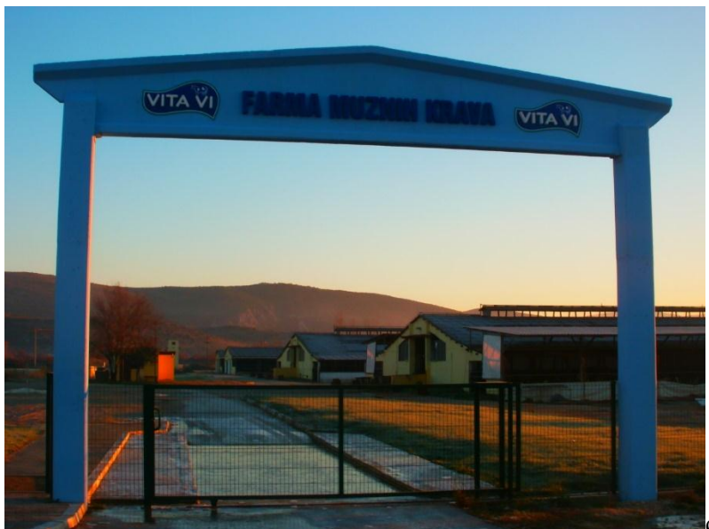
Slika 1. Farma Vita Vi

Farma Vita Vi d.o.o. osnovana je 1997. godine. Nalazi se u KO Višići, općina Čapljina. Sa zapadne strane je omeđena Parkom prirode „Hutovo blato“, sa južne strane sa „Agroherc d.o.o.“, sa zapadne strane naseljem Višići, a sa sjeverne strane naseljem Gnjilišta. Farma krava na ovom prostoru postoji preko 50 godina, naime već 1960. godine je u sklopu HEPOK-a osnovana OOUR Farma krava Hutovo blato,