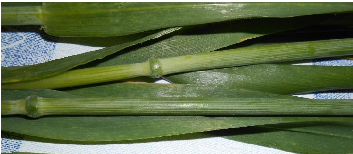
Slika 22. Pojava pepelnice u slabom intenzitetu i smeđa pjegavost lista

13.05.2016. utvrđena je u slabijem intenzitetu i pojava pepelnice, uz već utvrđenu S. tritici (slika 22.). S. tritici se proširila i na list zastavičar, ali u slabijem intenzitetu. U cilju zaštite lista zastavičara i klasa obavilo se suzbijanje kombinacijom fungicida Caramba u količini od 1,2 - 1,5 l/ha i Duett Ultra u dozi od 0,4 - 0,6 l/ha.