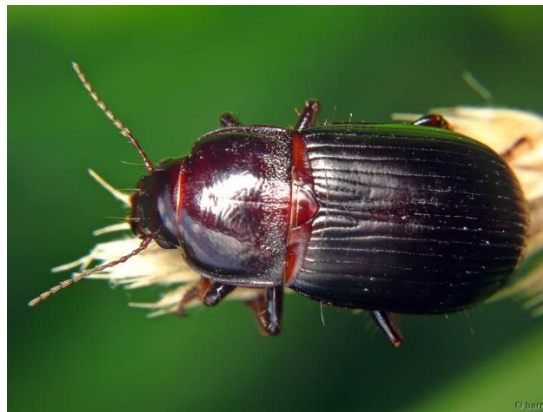
Slika 10. Žitarac crni

Štete pravi odrasli kukac (slika 10). Simptomi napada su oštećenja zrna na klasovima, a često pregriza klasove. Ličinke se po danu nalaze u tlu, na dubini oko 40 cm, noću izlaze radi hranjenja. Uspješno suzbijanje obavljamo tako da napravimo obvezan pregled tla prije sjetve ozime pšenice (Ivezić, 2008.). Pojavljuje u vrlo različitom intenzitetu u pojedinim godinama. U krajevima gdje je učestala pojava, strnište je poželjno plitko preorati. Kod jake zaraze treba primijeniti odgovarajuću kemijsku zaštitu.