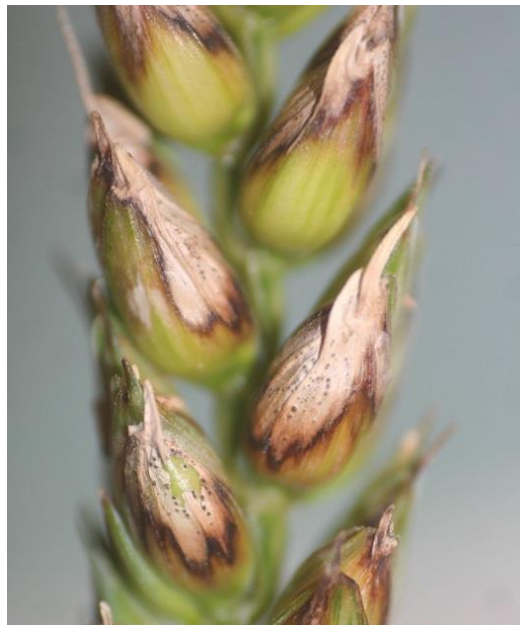
Slika 5. Septoria nodorum na klasu

Uzročnik je jedne od najčešćih i najopasnijih bolesti klasa tijekom kišnih godina. Ekonomski gubitci nastaju uslijed slabijeg dozrijevanja pšenice, zbog čega se pojavljuje veliki broj šturih zrna kojima je težina smanjena (Ćosić i sur. 2006.). Ova gljiva se može uočiti na koleoptil, plojkama, rukavcima, vlatima i vretenu. Simptomi na listovima su jednaki kao i kod S. tritici . Zaraza se prepoznaje po tome što su vidljive smeđe ovalne pjege s tamnijim rubom. Na klasu od simptoma uočavamo male smeđe pjege na gornjoj polovini vanjske pljeve (slika 5.). Pjege se s vremenom povećavaju, a mogu se i spojiti. Male crne točkice, piknidi nalaze se u unutrašnjosti. Zaražena zrna su deformirana i smežurana s karakterističnim smeđim pjegama. Gljiva preživljava tijekom ljeta na žetvenim ostacima ili korovnim vrstama saprofitski. Zaraza se obavlja askosporama, konidijama ili micelijem, Razvoju bolesti pogoduju izmjene kiše i sunčanog vremena. Od mjera zaštite značajno je duboko zaoravanje žetvenih ostataka, izbalansirana gnojidba, suzbijanje korova i uređivanje površina oko oranica, širi plodored, sjetva manje osjetljivih sorata i primjena fungicida.