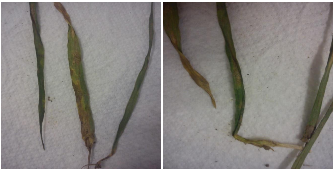
Slika 18,19. Septoria tritici na pšenici

Tijekom obilaska polja 08.3.2016 prvi puta su uzeti uzorci pšenice. Na listovima pšenice su bili vidljivi simptomi zaraze sa smeđom pjegavosti lista, koju uzrokuje Septoria tritici (slika 18.). Zbog povoljnih vremenskih prilika za razvoj uzročnika simptomi su uočeni već u ožujku, a slična opažanja imali su Bijelić i sur. (2013.). Pjege su bile u jačem intenzitetu na prizemnim listovima; svjetlo smeđe boje s tamnijim rubom (slika 19.). Unutar pjege uočeni su piknidi. Zaraza je utvrđena na oko 30% biljaka. Zaraza je zahvatila mlado lišće. Suzbijanje se obavilo tretiranjem sa sistemičnim fungicidom Zino u dozi 250 - 360 ml/ha.