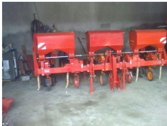
Slika 12. Sijačica na OPG-u „Dugina“

Sredinom listopada 2015. godine obavljena je predsjetvena priprema tla i gnojidba. U predsjetvenoj pripremi tla je korištena tanjurača, iako je tlo bilo dosta vlažno. Sjetva pšenice započela je 14. listopada, a završena je 28. listopada 2015. godine. Sjetva je obavljena sijačicom za žitarice sa 185 - 215 kg sjemena/ha, na dubinu 4 cm i međuredni razmak od 12 cm (slika 12.). U sjetvi su korištene sorte pšenice Sofru i Graindor.