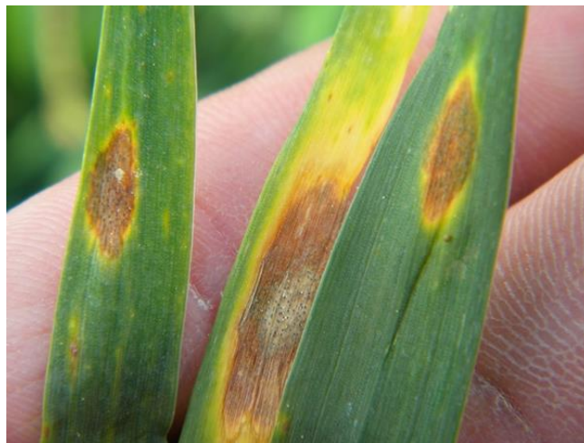
Slika 4. Simptomi pjegavost na lišću

Bolest je prisutna u svim uzgojnim područjima. Prvi simptomi se mogu javiti već u jesen u stadiju 2-3 lista. Zaraza utječe na smanjenje asimilacijske površine listova, razvoj mladih listova i na smanjenje mase 1000 zrna. Prepoznaje se po malim okruglim ili ovalnim klorotičnim pjegama. Pjege su svjetlo smeđe boju s tamnijim rubom (slika 4.). One su prvo vidljive pri vrhu najstarijeg lišća. Napadaju plojku, rukavac lišća, a mogu se javiti i na stabljici. Ukoliko je utvrđen veliki broj pjega lišće se počinje suši (Van Ginkel i sur., 1999.). Gljiva prezimi kao micelij ili u obliku piknida na biljnim ostacima. Tijekom ljeta se održava na žetvenim ostacima kao saprofit ili na korovima. Razmnožavanje gljive se obavlja spolno i nesporno. Nesporno razmnožavanje je pomoću konidija, a spolno pomoću pesudotecija. Od mjera zaštite najvažnije je zaoravanje žetvenih ostataka i samonikle pšenice, izbalansirana gnojidba, sjetva u optimalnom roku, plodored, sjetva tolerantnih sorata, uništavanje alternativnih domaćina (korova) i uporaba fungicida.