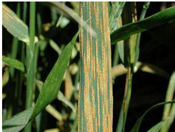
Slika 3. Puccinia striiformis simptomi

Bolest se do nedavno javljala sporadično i nije bilo značajnijih šteta, međutim u 2014. utvrđena je u epidemijskim razmjerima. Napada sve nadzemne dijelove žitarica (pšenica, ječam, zob, raž). Najkarakterističniji simptomi bolesti su na plojci, te pljevicama, a slabije se pojavljuju na rukavcu i vlati (slika 3.). Jak napad na pljevice je štetan jer značajno smanjuje punjenje zrna. Na početku bolesti na listovima nastaju uredosorusi koji izgledaju kao limun žute boje. Po nastajanju su pojedinačni, vrlo sitni (0,5 - 1,0 mm x 0,3 - 0,5 mm). Kod zaražena pšenice dolazi do nekroze i sušenja zaraženih dijelova lista. Pljevice djelomično ili potpuno poprime smeđu boju. Pred kraj vegetacije nastaju teleutosorusi crne boje koji su trajno pokriveni epidermom i u kojima se nalaze teleutospore. Na pojavu hrđe povoljno utječe hladno i vlažno vrijeme. Optimalne temperature za klijanje uredospora su od 10 do 15 °C uz vlagu 100%. Životni ciklus je pri tim temperaturama kratak. Uredospore su otporne na temperaturu do -15 °C pri kojoj mogu ostati vitalne do tri mjeseca (Kišpatić, 1992.).