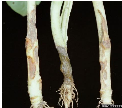
Slika 6. Fuzarijska palež klijanaca

Palež klijanaca je posljedica žetve zaraženog sjemena (slika 6.). Dio zaraze dolazi zbog sjetve zaraženog sjemena ili zdravog sjemena u zaraženo tlo, pa klijanaci mogu propasti prije nicanja ili neposredno nakon nicanja (Ćosić i sur. 2006.).