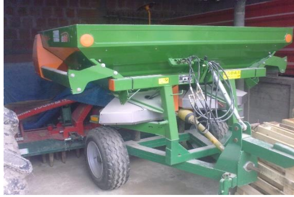
Slika 13. Rasipač na OPG-u „Dugina“

Prihrana je obavljena 26.02.2016. sa 170 kg/ha KAN-a. Njega usjeva obavljena je sredinom studenog, obavljeno je valjanje s drljanjem zbog jake zbijenosti tla. Valjanje s drljanjem uspostavilo je bolji kontakt sjemena i tla i omogućeno je brže klijanje i nicanje. Žetva pšenice obavljena je 6.07.2016. Prinos pšenice iznosio je 6.5 t/ha. (slika 14.).