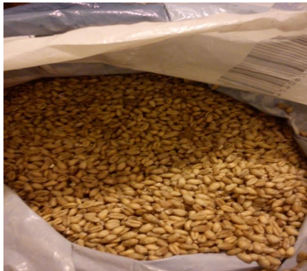
Slika 14. Pšenica nakon žetve

Prihrana je obavljena 26.02.2016. sa 170 kg/ha KAN-a. Njega usjeva obavljena je sredinom studenog, obavljeno je valjanje s drljanjem zbog jake zbijenosti tla. Valjanje s drljanjem uspostavilo je bolji kontakt sjemena i tla i omogućeno je brže klijanje i nicanje. Žetva pšenice obavljena je 6.07.2016. Prinos pšenice iznosio je 6.5 t/ha. (slika 14.).