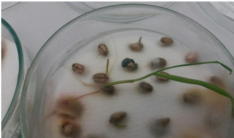
Slika 24. Zaraza zrna pšenice različitim rodovima gljiva