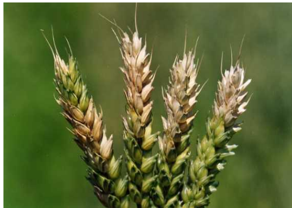
Slika 7. Fuzarijska palež klasova

zelene boje, a zaraženi klasovi gube boju, postaju slamnato žuti, odnosno bijeli te su uspravni (slika 7.). Od posljedice napada zrna su sitna i smežurana, a vrlo često ne proključaju. Uvjeti koji pogoduju ovoj bolesti su dužina cvatnje, kišna godina i visoka relativna vlažnost zraka (85%) uz temperature oko 25 °C (Champeil i sur. 2004.). Suzbijanje gljiva iz roda Fusarium obavlja se neizravnim i izravnim, odnosno kemijske mjerama suzbijanja. Najznačajnija neizravna mjera jest plodored u kojem se pšenica ne bi trebala sijati iza kukuruza. Žetvene ostatke treba duboko zaorati u tlo, poželjno je koristiti i deklarirano sjeme kao i otporne sorte. Izvor zaraze mogu biti i neki korovi (Ilić i sur. 2012.). Kemijsko suzbijanje provodi se od početka pa do pune cvatnje žitarica. Kod prskanja treba obratiti pažnju o jačini vjetra jer klas treba biti tretiran sa svih strana.