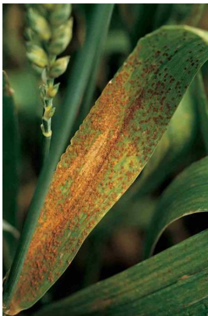
Slika 2. Puccinia recondita simptomi na listu

Smeđa hrđa pšenice pojavljuje se svake godine u slabijem ili jačem intenzitetu. Pojavom ove bolesti prinosi se mogu smanjiti od 5 do 10 %, a u iznimno povoljnim godinama gubici mogu biti i znatno veći (do 70%) (Ćosić i sur., 2006.). Na pšenici napada najčešće list. Puccinia recondita na gornjoj strani plojke stvara uredosoruse koji su svijetlije ili tamno smeđe boje. Spajaju se u slučaju jakog napada, okrugli su i veličine 1-2 mm (slika 2.). U drugom dijelu vegetacije na donjoj strani plojke razvijaju se okruglasti crni obojeni teliosorusi koji su pokriveni epidermom. Sadrže teleutospore koje izvršavaju zarazu prijelaznog domaćina. Uredospore ostaju aktivne i zimi ukoliko temperatura nije manja od 2 do 3 °C. Vrlo su vitalne, a svoju klijavost mogu očuvati i do 220 dana. Prenose se vjetrom. Do infekcije može doći pri temperaturnom rasponu od 2 do 32 °C, a potom dužina inkubacije ovisi o temperaturi (Kišpatić, 1992.). Od mjera zaštite pored sjetve tolerantnijih sorata u godinama jakog napada treba obaviti i tretiranje fungicidima.