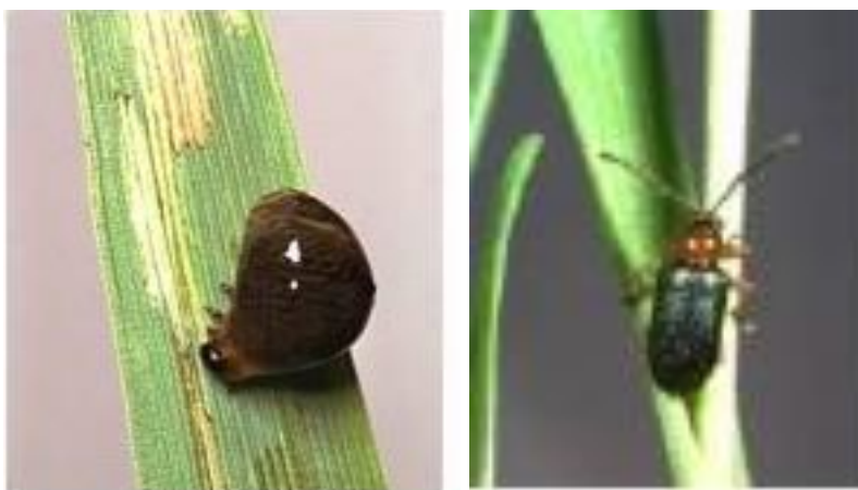
Slika 8. i 9. Ličinka i odrasli oblik žitnog balca

Kornjaš plave boje, nadvratnjak i noge su mu narančaste boje, a glava i ticala su crne boje (slika 8.). Njegova dužina kreće se oko 4 mm. Ličinke su žute. Svojim izgledom podsjeća na balavog puža zbog toga što je ličinka pokrivena crnom sluzi koja je nastala od izmeta (slika 9.). Odrasli kukci se hrane listom izgrizajući ga u vidu pruga. Ličinke se hrane isto gornjim slojem lista, što dovodi do pojave prozirnih izduženih pruga. Pojavljuje se i lokalno te čini mjestimične štete (Ivezić, 2008.). Od preventivnih mjera suzbijanja značajna je je duboka jesenja obrada tla, gdje se žitni balac unosi u dublje slojeve i tako se uništava. Kod jačeg napada tijekom vegetacije, osnovno suzbijanje ličinki vrši se kada je utvrđena 1 ličinka po zastavici.