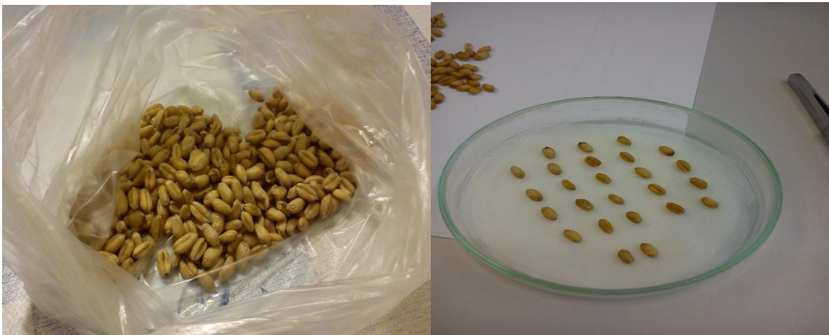
Slika 15,16. Postavljanje pšenice za pokus

Slučajnim izborom nakon žetve uzeto je 400 zrna sorte Sofru sa obiteljskog poljoprivrednog gospodarstva Dugina (slika 15.). Zrna su ispirana 75 % etilnim alkoholom u trajanju od 30 sekundi. Nakon toga su pravilno raspoređena na vlažan filter papir u Petrijeve zdjelice. Ukupno je stavljeno 400 zrna, po 25 zrna u četiri ponavljanja (slika 16 ). Na dno svake Petrijeve zdjelice stavljeno je tri filter papira, a jedan u poklopcu. Petrijeve zdjelice su stavljene u termostatsku komoru na temperaturu 22 °C, svjetlosni režim 12 sati dan/ 12 sati noć i RVZ 70 % (slika 17.). Nakon 24 sata Petrijeve zdjelice su stavljene na 24 sata zamrzavanja. Potom su vraćene u termostatsku komoru na temperaturu 22 °C, svjetlosni režim 12 sati dan/ 12 sati noć i RVZ 70 %. Sedmog dana je rađen pregled zrna i analiza zaraženosti.