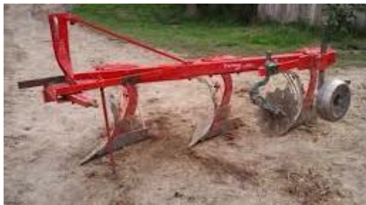
Slika 11. Trobrazdni plug na OPG-u „Dugina“

Pšenica je bila zasijana na 60 hektara. Predusjevi su bili suncokret (30 ha) i kukuruz (30 ha). Prije sjetve obavljeno je duboko oranje 25.09. 2015. godine trobrazdnim plugom na dubinu 30 cm (slika 11.). Budući da je prošla godina bila ekstremno kišna tlo je bilo teško za obradu.