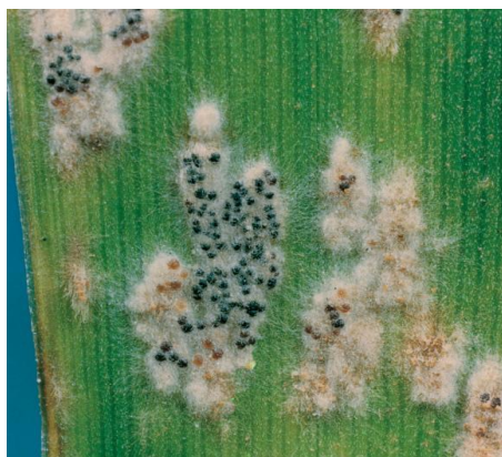
Slika 1. Pepelnica na listu pšenice

Pepelnica je jedna od najznačajnijih lisnih bolesti strnih žitarica, korovnog i kulturnog bilja. Gubici prinosa pšenice od prosječnog napada pepelnice iznose od 13 do 14 %. Glavni simptomi su bijelo sive ili pepeljaste prevlake. Nalazimo ih na licu i naličju lista (slika 1.). Kod biljno tkivo nekoliko dana nakon zaraze dolazi do gubitka zelene boje i do njegovog propadanja koje se očituje pojavom žute boje (Both i Spanu, 2004.). Gljiva se razmnožava nespolno konidijama i one se kod pepelnice nazivaju oidije. Nastaju na vrhovima ne razgranatih konidiofora pojedinačno ili u grupama. Mogu klijavati i bez prisustva vode. Najpovoljniji uvjeti za produkciju konidija, njihovo klijanje i infekciju je temperatura noću 16 °C vlaga oko 90%; a danju 27 °C vlaga između 40% do 70% ( Piarulli i sur., 2012.). Spolnom oplodnjom stvaraju se loptasta plodišta kleistoteciji. U njima se nalaze askusi s askosporama. Kleistoteciji tijekom zime ostaju na biljnim ostacima, a u proljeće za vrijeme toplog i vlažnog razdoblja apsorbiraju vlagu i pucaju. Od mjera zaštite najvažniji je plodored, sjetva otpornih sorata, ujednačena gnojidba zaoravanje žetvenih ostataka (“prašenje strništa”), izbjegavanje gustog sklopa i uništavanje samoniklih biljaka pšenice prije nicanja jesenjih usjeva.