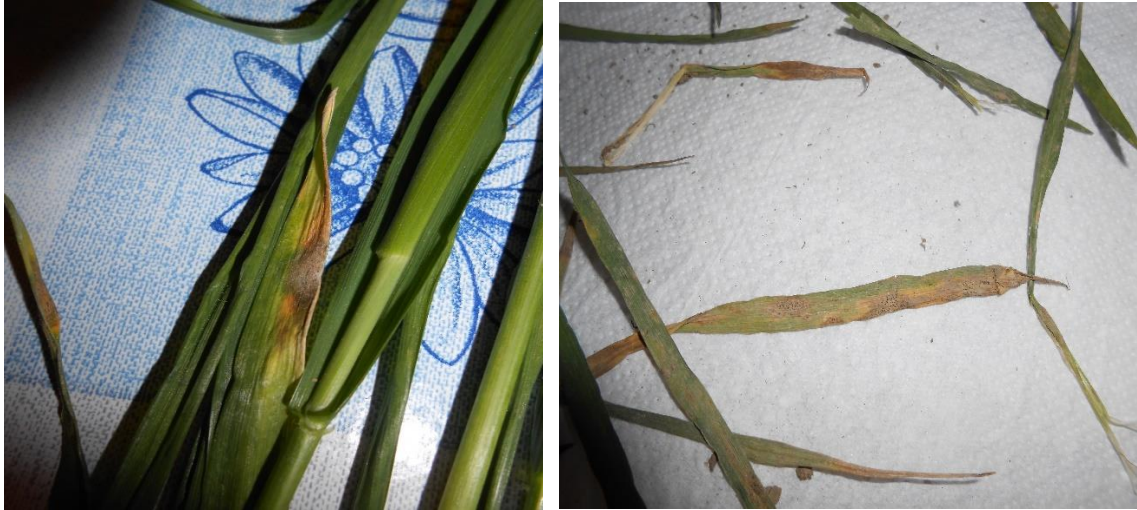
Slika 20,21. Septoria tritici na pšenici

13.05.2016. utvrđena je u slabijem intenzitetu i pojava pepelnice, uz već utvrđenu S. tritici (slika 22.). S. tritici se proširila i na list zastavičar, ali u slabijem intenzitetu. U cilju zaštite lista zastavičara i klasa obavilo se suzbijanje kombinacijom fungicida Caramba u količini od 1,2 - 1,5 l/ha i Duett Ultra u dozi od 0,4 - 0,6 l/ha.