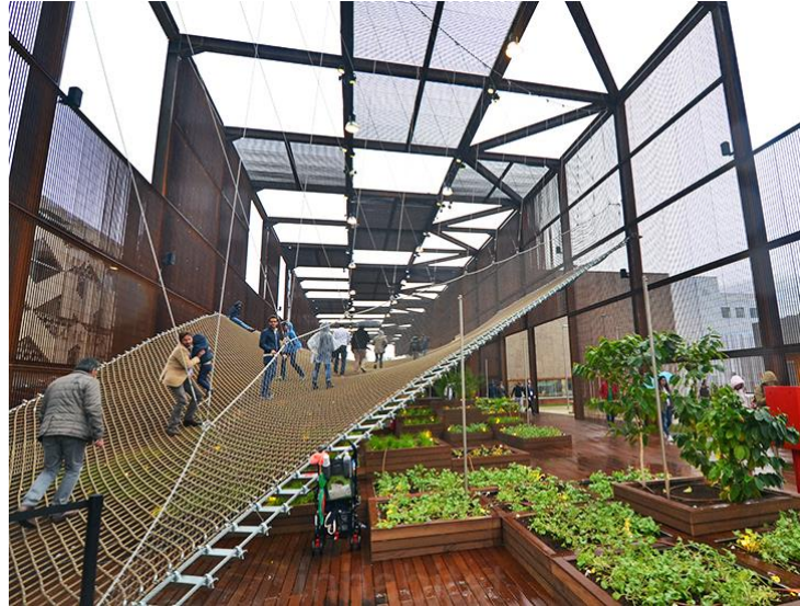
Slika 2: EXPO u Milanu, 2015. godine (Inhabitat, 2015.)

Impresivan uvid u istraživanja o kvaliteti ekološki uzgojenih namirnica ilustriramo studijom Francuske agencije za sigurnost hrane koja je provela evaluaciju nutritivne i zdravstvene kvalitete ekološke hrane, čiji je zaključak da ekološki proizvodi sadrže više minerala kao što su željezo i magnezij te više antioksidativnih mikronutrijenata poput fenola i salicilne kiseline (Biovega, 2016.).