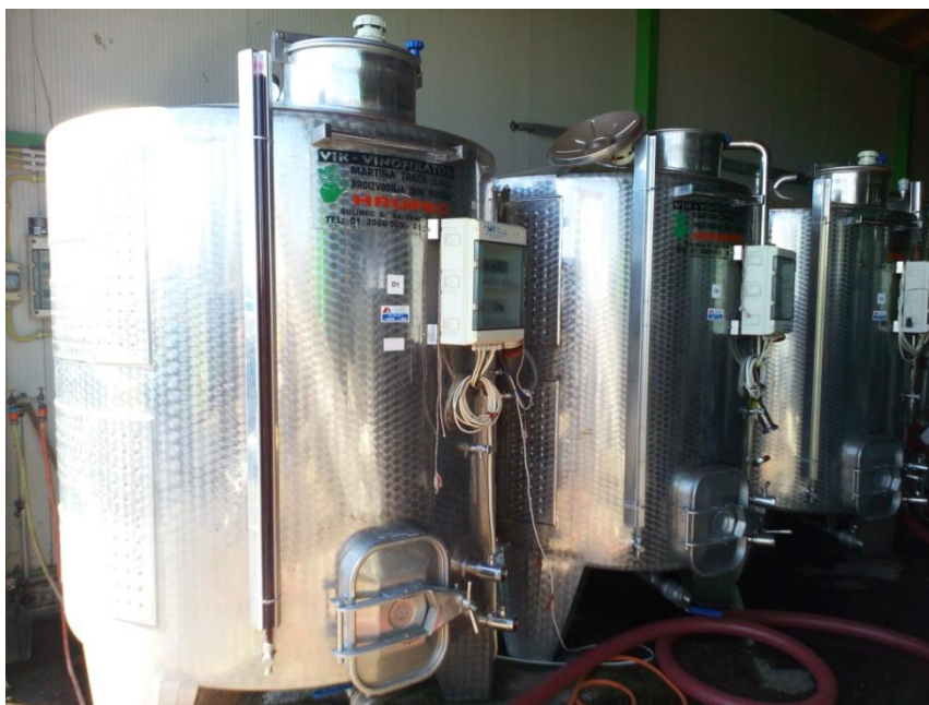
Slika 6. Vinifikatori zapremine 3 000 l u vinariji Josić