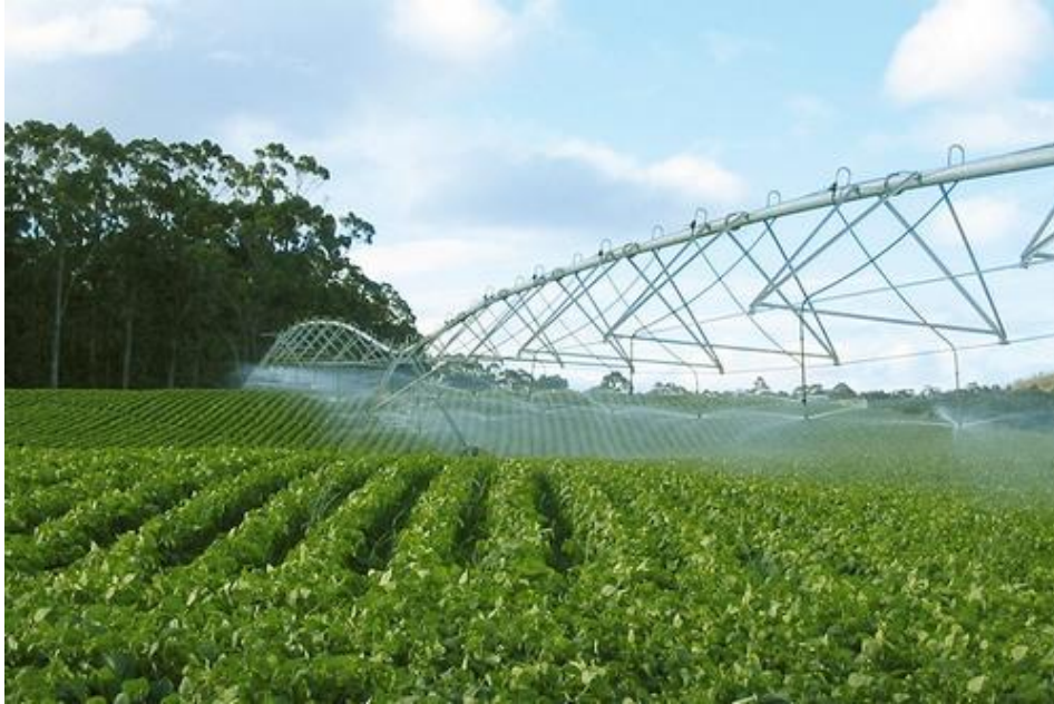
Slika 2. Sustav za navodnjavanje ( http://promodalmatia.com/sustavi-za-navodnjavanje-zadar/ )

Ako u uzgoju planiramo navodnjavanje najbolje je nakon sjetve ili u proходу sa sjetvom obaviti oblikovanje zbijene i profilirane grube površine. Ako želimo smanjiti gubitak vlage i brzog nicanja usjeva, možemo primijeniti obradu tla i sjetvu u trake ili direktnu sjetvu.