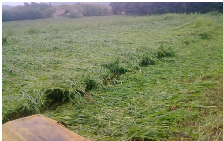
Slika 4. Sirak za zelenu krmu ( http://pinova.hr/hr_HR/baza-znanja/ratarstvo/sirak/koristenje-krmnog-sirka )

Sirak – u hranidbi domaćih životinja koristi se zrno ili nadzemna masa (zelena krma, silaža, sijeno). Sirak je nešto hranjiviji od kukuruza, a i bolje podnosi sušu. Za silažu se sije u redove razmaka 40-50 cm, a za zelenu kosidbu nešto gušće 20-30cm. Za silažu se kosi 14 dana prije zriobe a za krmu pri visini oko 1-1,5 m. U silaži toksične količine HCN smanjujemo isparavanjem u tijeku vađenja i primjene silaže, a u sijenu tijekom sušenja. Možemo ga koristiti i do 2-3 puta tijekom vegetacije zbog visoke biološke regeneracije nadzemne mase. Prinos zelene mase se kreće oko 70-120 t/ha a zrna 5-8 t/ha.